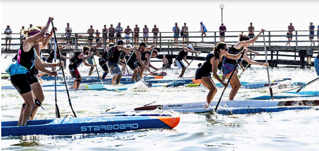
SUP-SM på Skrea strand i fjol. I år lockas ännu fler internationella deltagare till Falkenberg.