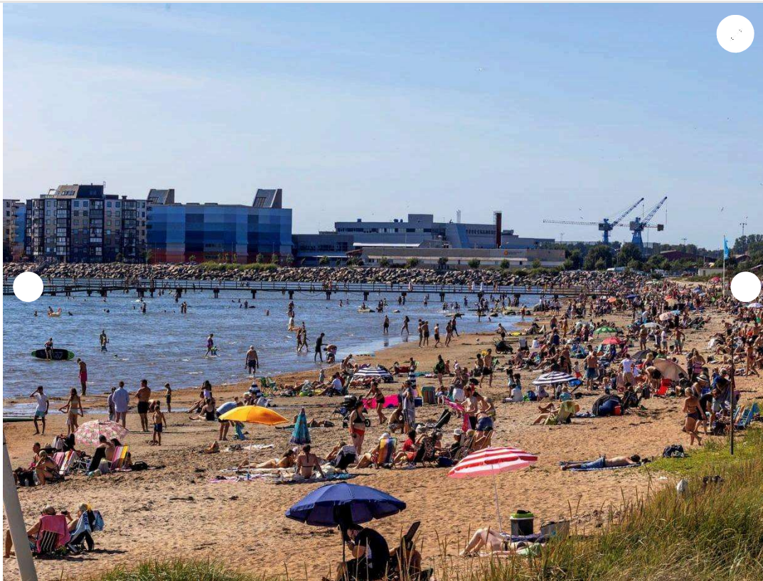
Det blir en dag på stranden.